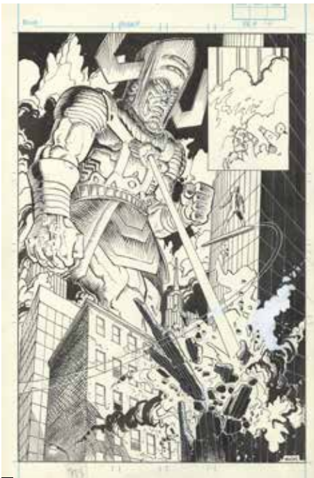
Silver Surfer Vol. 3 #2, unveröffentlichte Seite