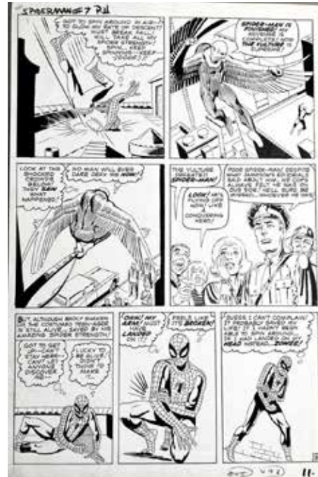
Amazing Spider-Man #7, S.9

Das Originalcover zur ersten Ausgabe der gefeierten Black Panther Reihe von Ta-Nehisi Coates und Brian Stelfreeze aus dem Jahr 2016.