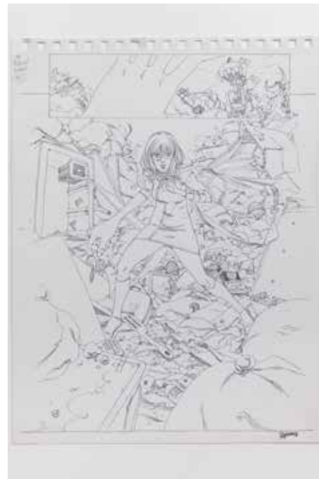
All-New Marvel Point One, S.32

Eine nie veröffentlichte Seite aus der Silver Surfer Reihe, gezeichnet vom international gefeierten Starkünstler Jean "Moebius" Giraud.