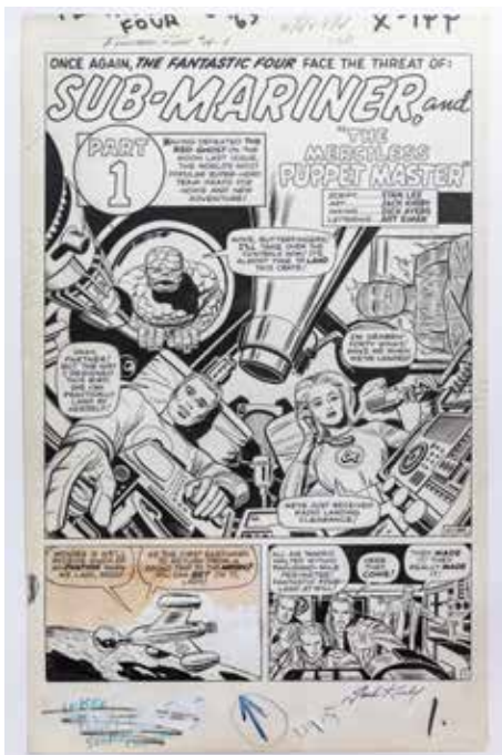
Fantastic Four #14, S.1

Eine seltene Originalseite aus der ersten Spider-Man Serie, gezeichnet vom an der Erschaffung des Charakters beteiligten Steve Ditko.