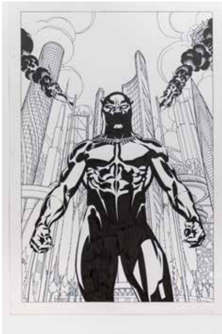
Black Panther Vol. 6 #1, Cover